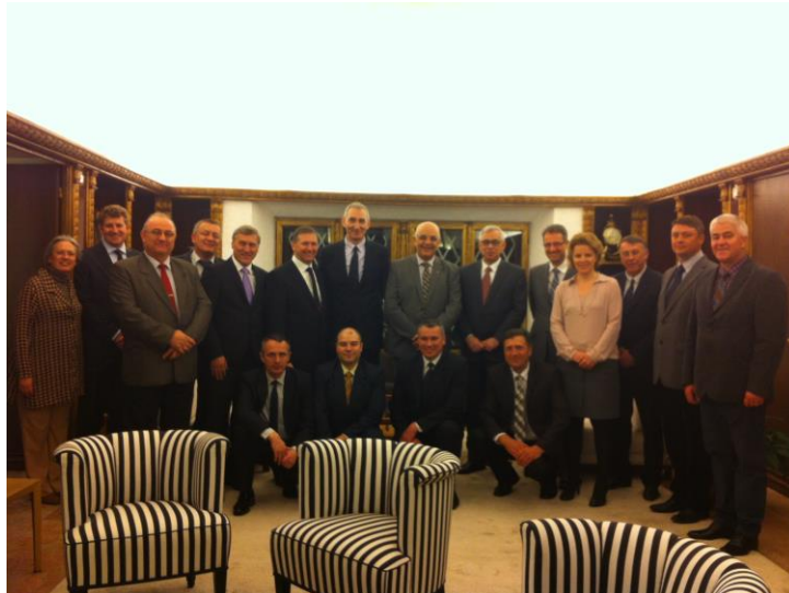
A la Résidence de l'ambassade de Suisse