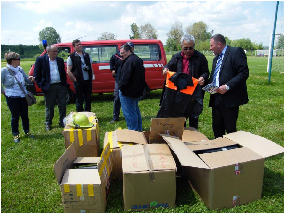
Remise de matériel au SVSU de Bonțida

Le 15 mai, du matériel pour les pompiers volontaires de la commune de Bonțida (CJ) a été remis aux autorités locales, poursuivant ainsi le développement des pompiers de la région.