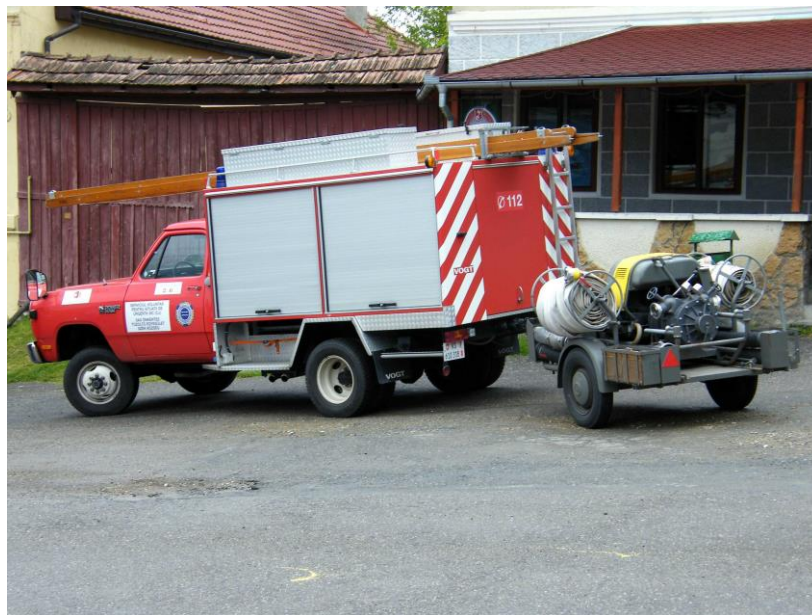
Remise des clés au maire de Sic/Szék,

Cette action, menée en collaboration avec le Rotary-Club de Gherla, s'est déroulée en présence de l'Inspecteur-chef de l'ISU du județ de Cluj, le colonel Moldovan. Une délégation de l'Association Nendaz-Gherla, ainsi que du partenaire belge de Sic/Szék, avaient fait le déplacement pour l'occasion.