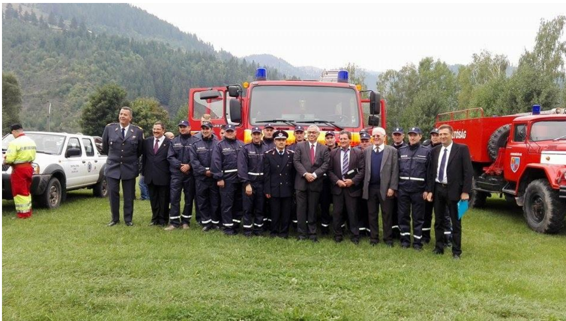
Les pompiers volontaires et les représentants des partenariats devant le camion de Lunca de Jos/Gyimesközéplök