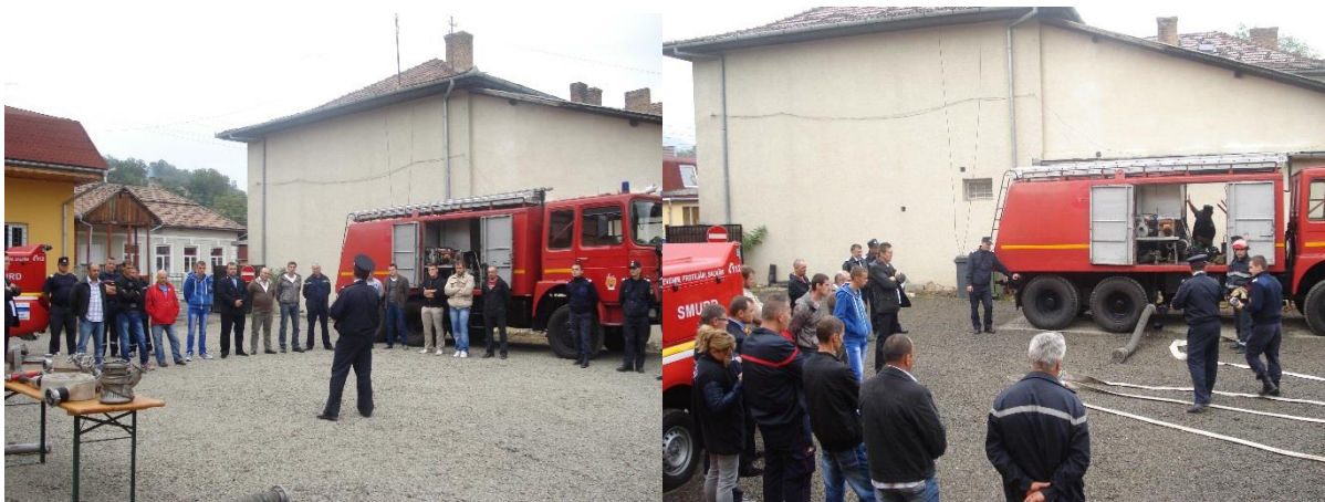
Après la théorie, la pratique...