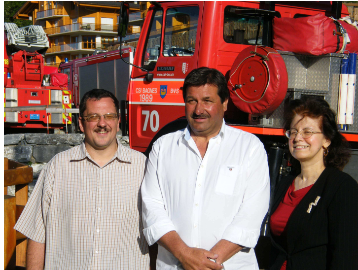
La marraine et le parrain en compagnie du président de l'Association

Les participants ont ensuite partagé un brunch et profité de la cantine et de l'animation musicale.