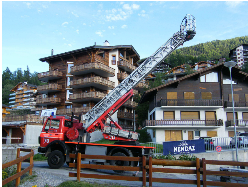
Camion-échelle remis en faveur de Gherla