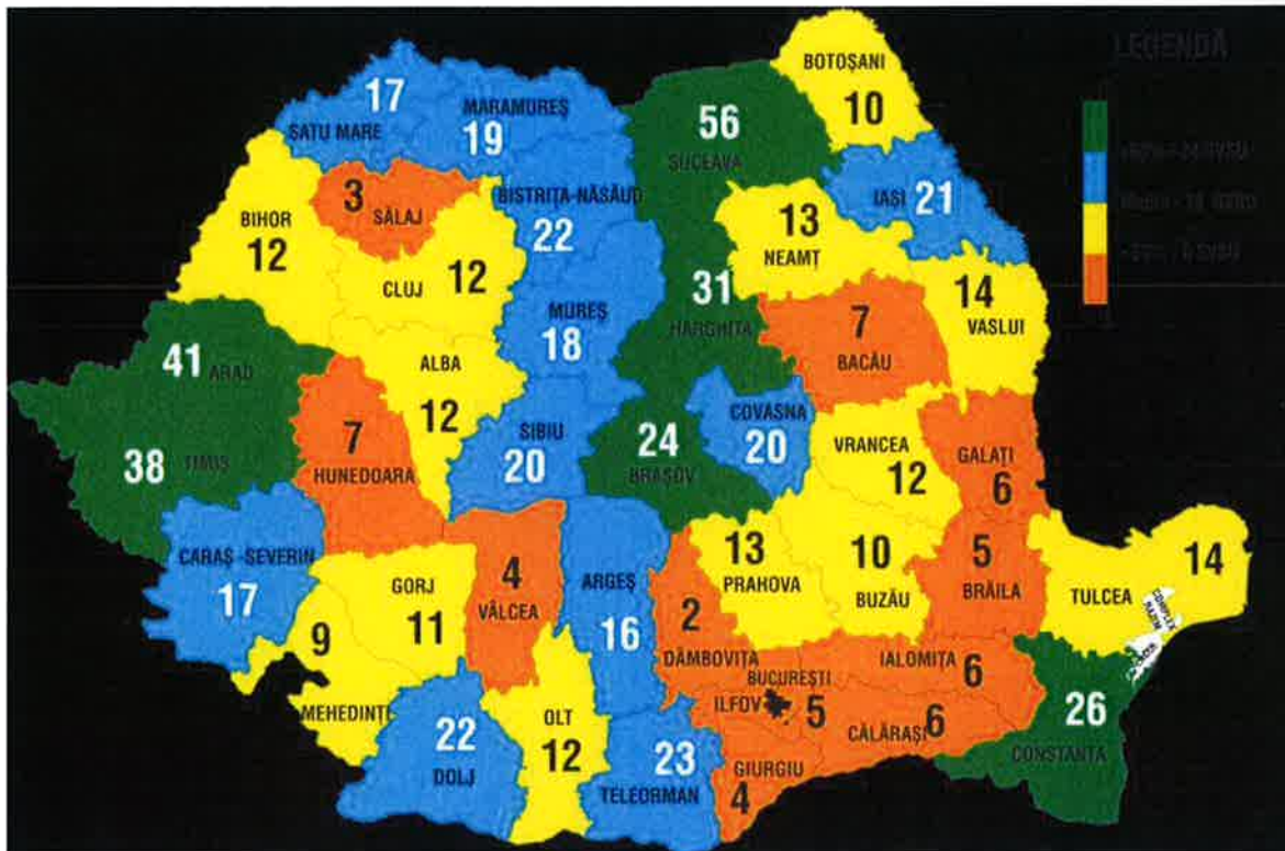
Nombre de véhicules propriété des mairies et des services pompiers volontaires (SVSU, Serviciul Voluntar pentru Situații de Urgență)

Un constat évident... Il y a urgence à faire quelque chose... Perdre son bien dans un incendie est un drame dans tous pays mais il prend encore une autre signification quand ce bien est la seule fortune dont l'on dispose et qu'il n'y a pas d'assurance.