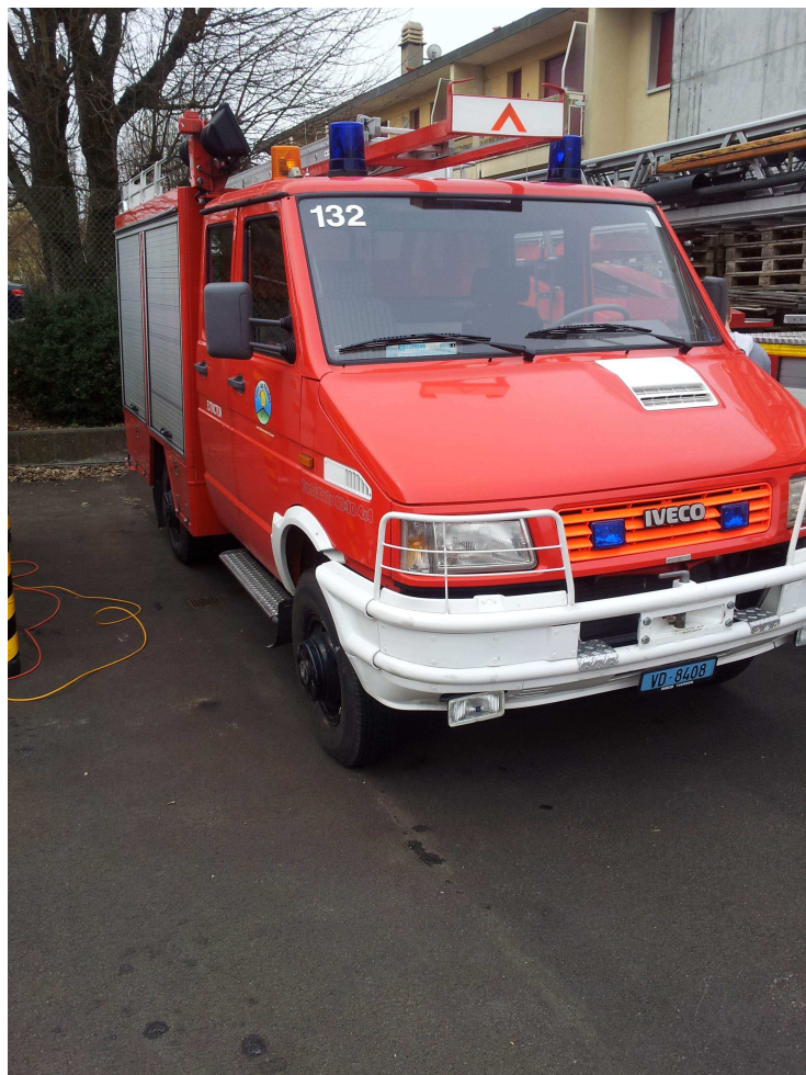
Véhicule qui sera préparé et remis au Centre pompiers de Chiril/Crucea (SV)

Du matériel pour les pompiers volontaires de Crucea a déjà été transmis en juin 2012 à la mairie de la commune. En juin c'est un petit camion tonne-pompe totalement équipé (qui nous a été remis par l'ECA Vaud que nous remercions chaleureusement), une moto-pompe et du matériel et équipement complémentaire qui seront remis au maire de la commune de Crucea.