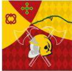
St-Légier - la Chiésaz