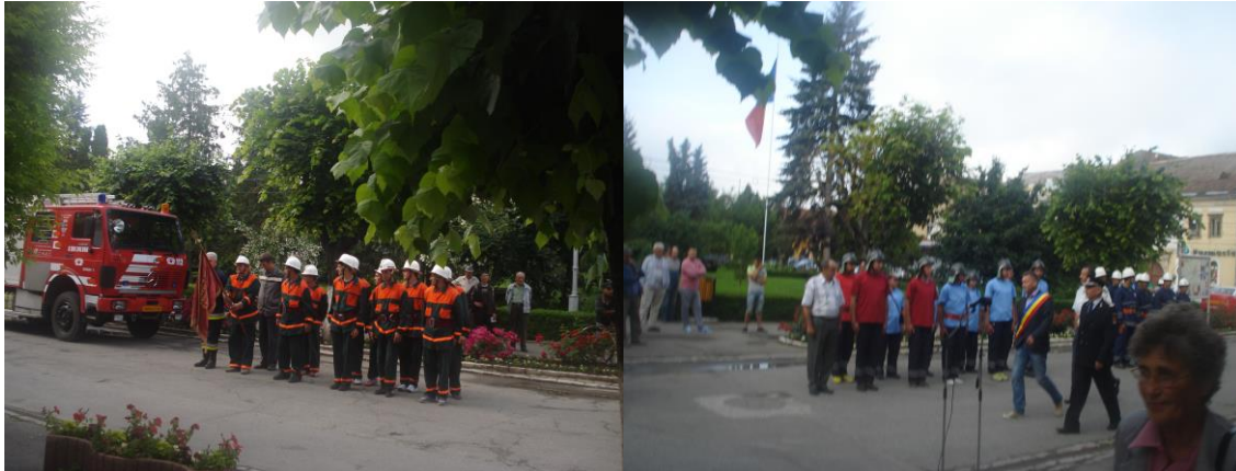
Les pompiers du SVSU Gherla lors de la cérémonie d'ouverture