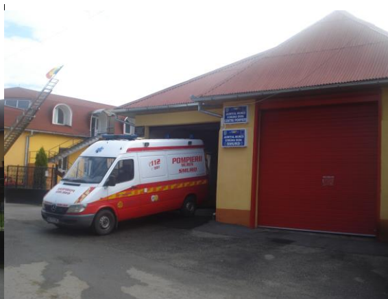
La caserne ISU/SVSU financée par la mairie de Deda...