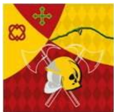
St-Légier -la Chiésaz