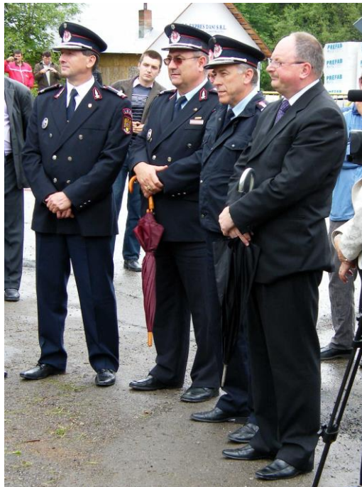
Lors de l'inauguration du centre régional Crucea (06.2013)