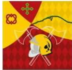
St-Légier -la Chiésaz