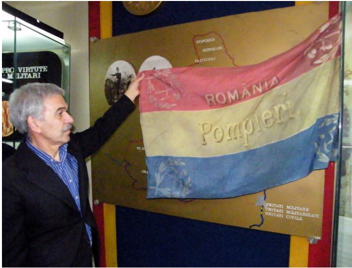
Le directeur du musée nous présente sa collection