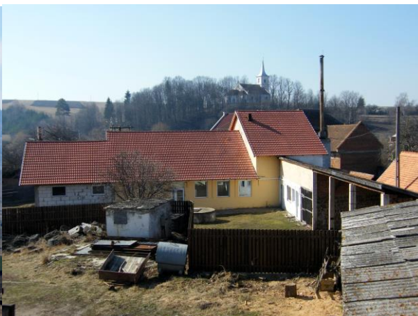
Prochainement : le local du feu