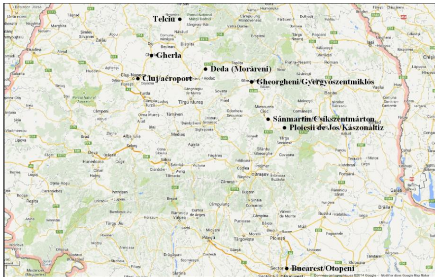
Le parcours du voyage

Dans ce numéro spécial, nous reviendrons sur les grandes lignes de ce voyage. Les projets mis en place à cette occasion feront l'objet d'une publication dans le prochain « Info-Flash ». Merci à Vera Rossel pour la prise de notes durant les visites et à Hubert Rossel pour les photos que vous retrouverez dans ce numéro.