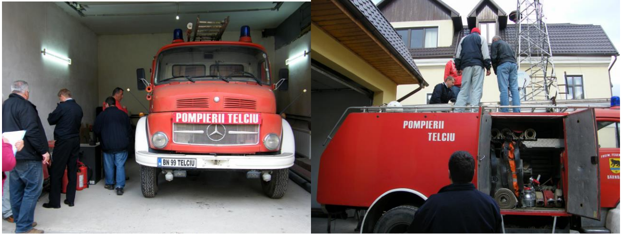
L'actuel camion de la mairie de Telciu