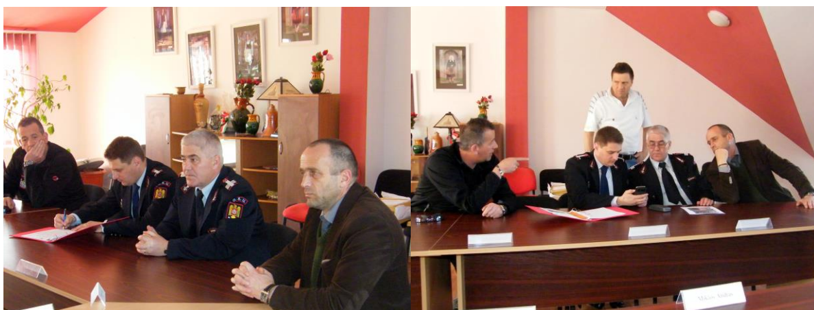
Séance de travail avec le Maire de Kászonalitz/Plaiesii de Jos et les représentants de l'IJSU