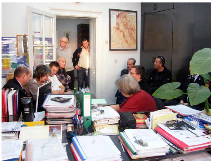
Réunion de travail à la mairie

Le centre régional Csíkszentmárton/Sânmartin regroupera les 9 communes voisines. Actuellement la commune dispose déjà d'un camion tonne-pompe. La dotation du centre sera donc complétée.