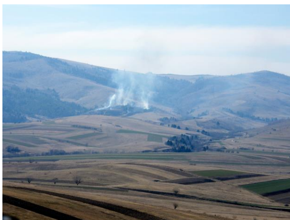
De nombreux incendies de forêt