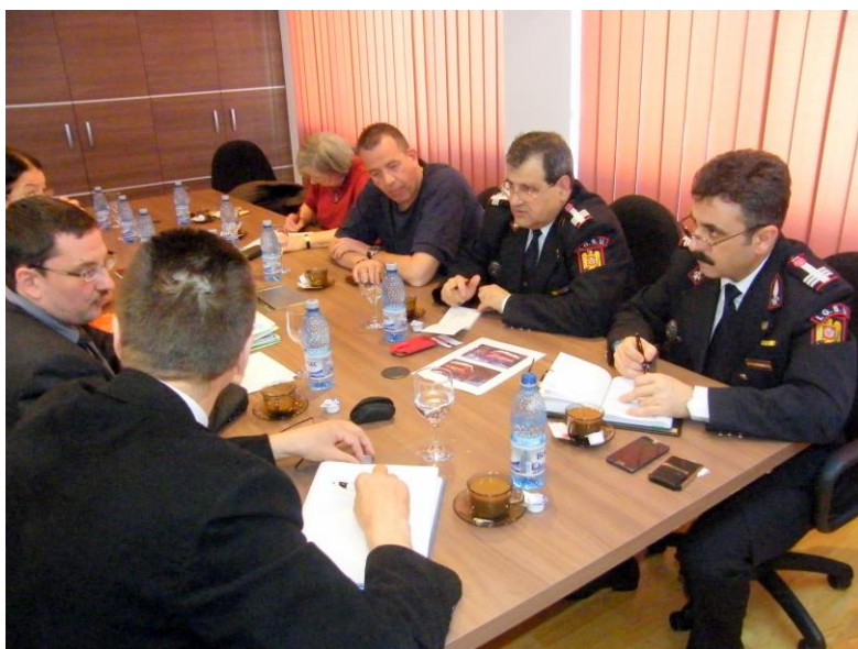
Séance de travail à l'IGSU