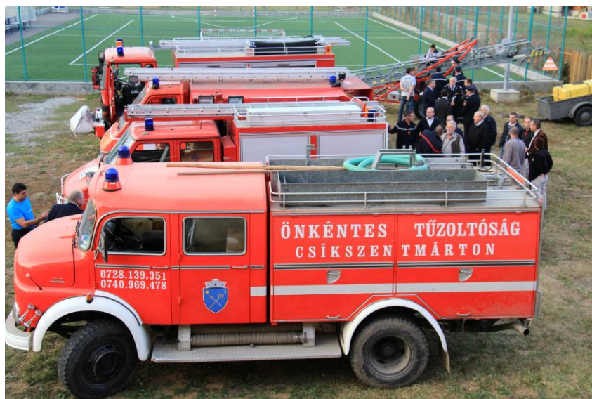
Dans l'ordre le camion du SVSU de Sânmartin, le camion pour Crucea et celui pour Plăieșii de Jos qui seront remis le lendemain et le camion remis à Sânmartin

Au son de la fanfare, les participants sont invités à découvrir le matériel remis, puis rejoindre la salle de la maison de la culture pour le repas offert par la Mairie de Sânmartin et poursuivre les discussions.