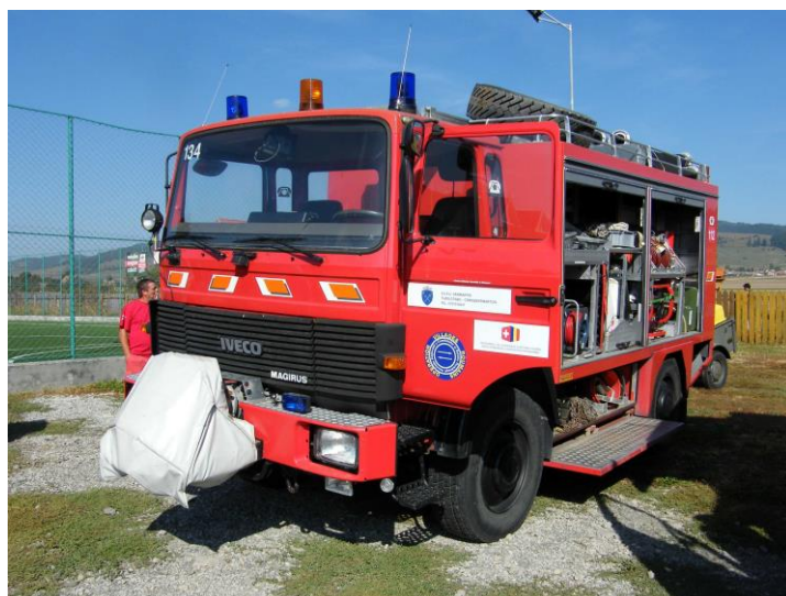
Le camion remis à Sânmartin

C'est en fanfare que s'est déroulée cette première inauguration le vendredi en fin de journée à Sânmartin/Csíkszentmárton (HR), partenaire de la commune de Meyrin, avec la remise d'un véhicule de transport équipé avec 1.5 km de tuyaux. De l'équipement est également remis (équipements personnels, moto-pompe, chariot-échelle, etc). Ce véhicule complète la dotation existante des pompiers de Sânmartin qui possédaient déjà un camion tonne-pompe.