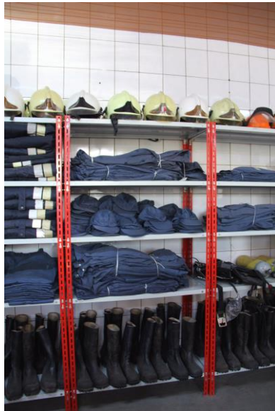
Matériel venu de Suisse qui va encore servir.