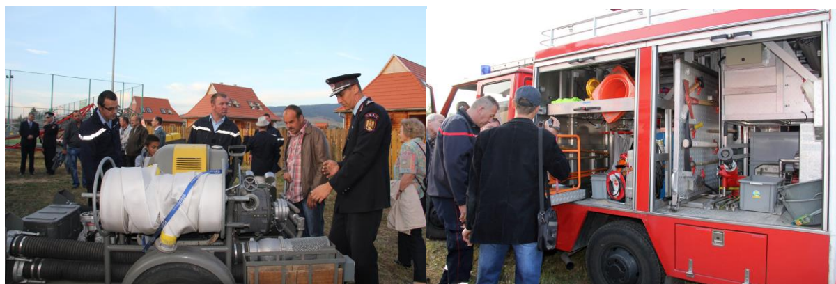
La moto-pompe pour Sânmartin et le camion pour Crucea