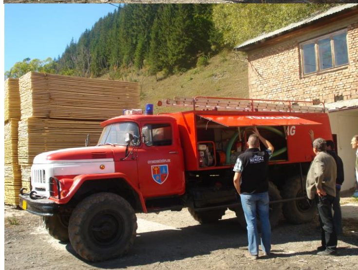
Camion actuel de la commune de Lunca de Jos

A cette occasion, nous remettons également aux autorités du centre régional de Crucea (SV) un petit véhicule de première intervention, en présence des représentants du partenaire suisse, la ville de Moutier (BE).