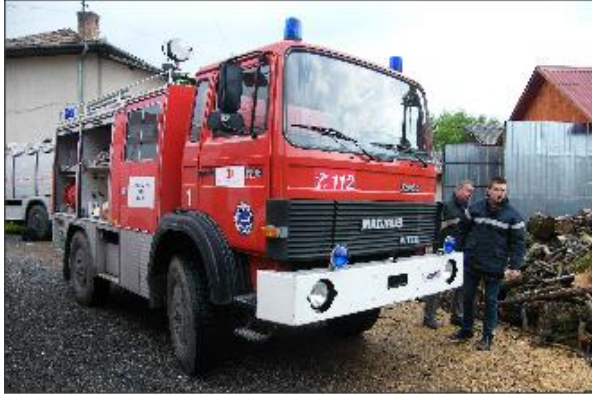
Le dernier camion tonne-pompe prévu pour le SVSU de la commune de Deda (MS)