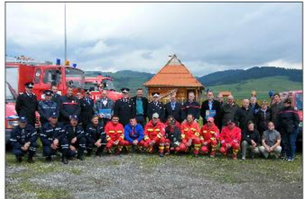
Un 4 x 4 de transport, aussi prévu pour les routes forestières, est venu renforcer le SVSU de Kászontíz/Plăieșii de Jos