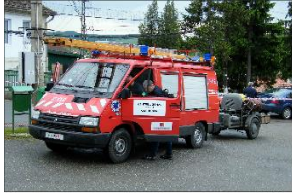
Le camion d'intervention et la moto-pompe remis aux autorités pour le SVSU de la commune de Sic/Szék (CJ)