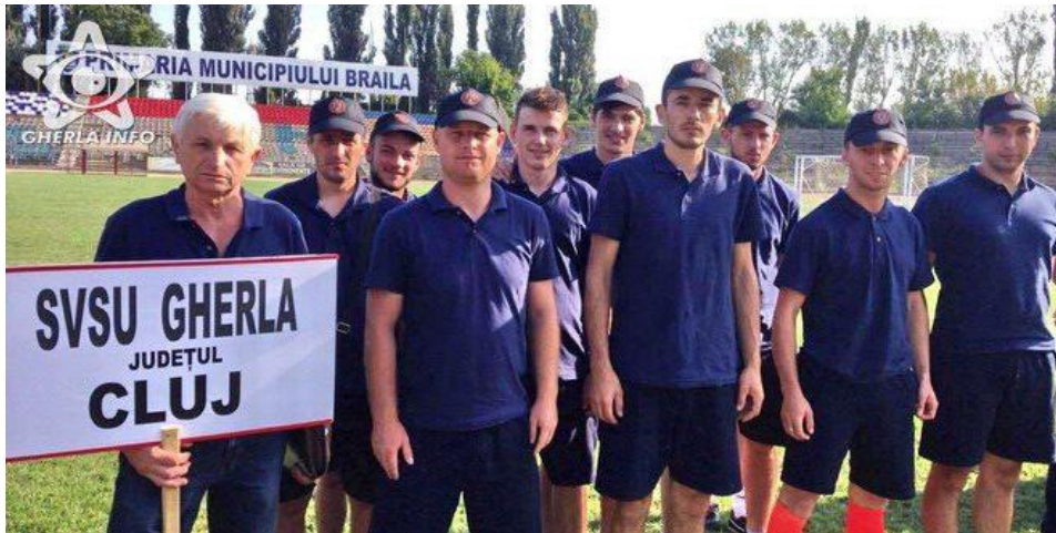
L'équipe SVSU de Gherla lors du concours

Au terme de cette compétition, l'équipe de Gherla s'est classée au 3 ème rang... Nous sommes fières de compter dans notre projet la 3 ème meilleure équipe de volontaires de Roumanie et adressons nos sincères félicitations au SVSU Gherla