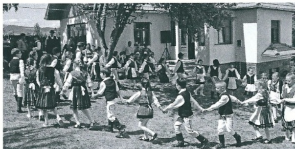
Fête de Csutak 2015

Depuis plus de six ans déjà, notre propriété de Csutak fonctionne comme un des cœurs de ce quartier excentré de Remetea. Elle accueille diverses festivités et offre hebdomadairement un lieu de rencontre chaleureux et convivial pour les personnes âgées et pour les enfants. Le développement de son activité a été confié à l'association Csutakfalvaert (pour Csutak), dont les membres œuvrent avec générosité et simplicité au renforcement du lien social. Du soleil et des sourires, pour illustrer le bel état d'esprit qui anime ces lieux.