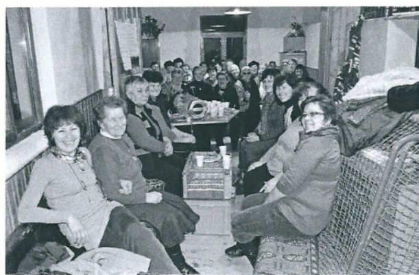
Des activités sociales, culturelles et festives destinées à tous