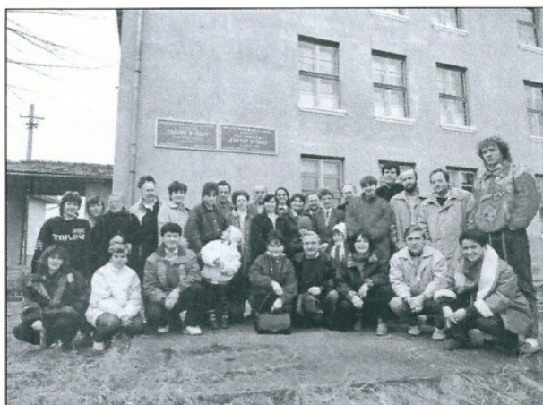
Délégation suisse à Remetea, automne 91