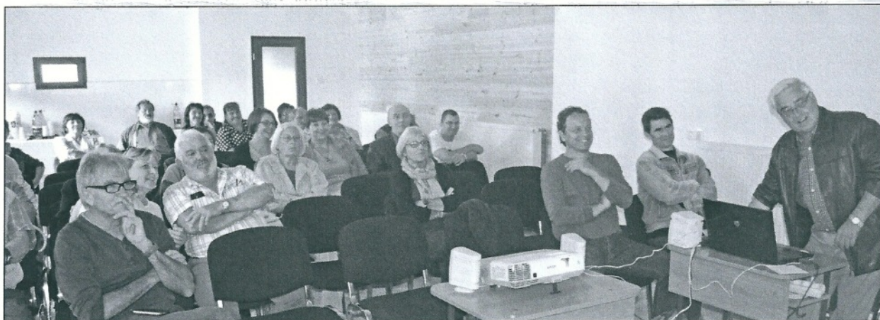
Projection d'un diaporama retraçant 25 ans de liens entre nos communes, lors de l'inauguration de la nouvelle salle.