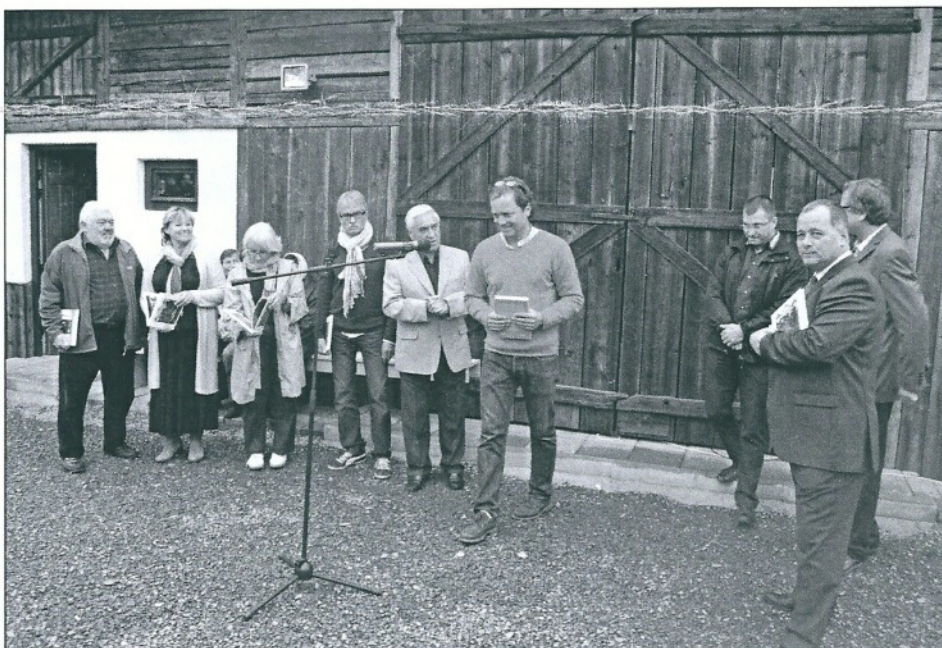
Discours d'inauguration de la grange Csutak