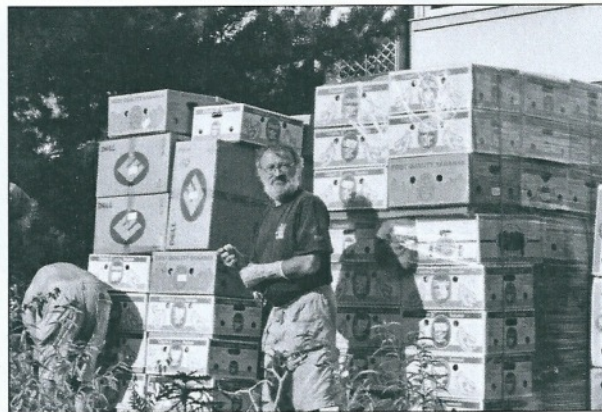
Une douzaine d'envois de matériel : habits, chaussures, médicaments, ...