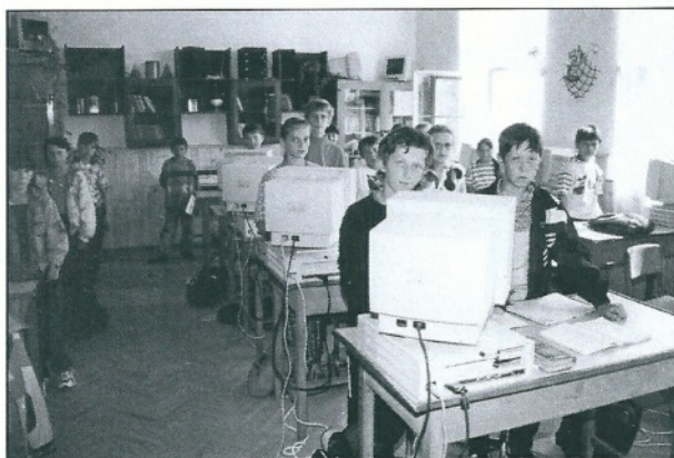
Aide aux écoles et jardins d'enfants : premiers ordinateurs dans les écoles de Remetea