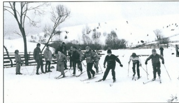
Aide aux activités sportives et culturelles : matériel de ski, hockey, foot, ...