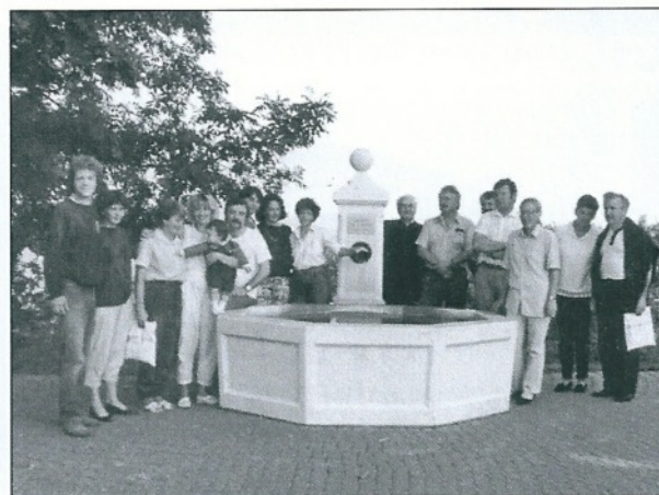
Délégation roumaine devant la fontaine Remetea, printemps 91