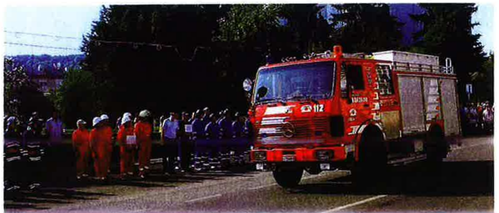
Inauguration officielle en grande pompe.