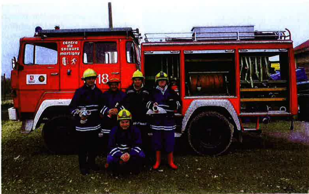
Parés pour l'intervention!

boration avec le Rotary-Club du Chablais d'un véhicule d'intervention.