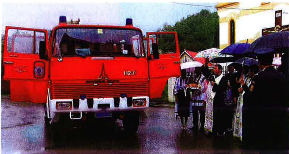
Durant la cérémonie de bénédiction du véhicule à Deda.

Le centre de service de pompiers volontaires d'Oltina a été mis sur pied suite à la remise, en été 2009, par les pompiers de la ville de Martigny (VS) en colla-