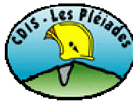
Blonay St-Légier –la Chiésaz