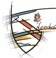
Commune de Nendaz 1996 Basse-Nendaz