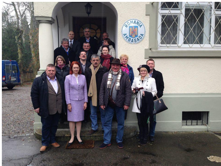
Photo souvenir de la délégation devant l'ambassade